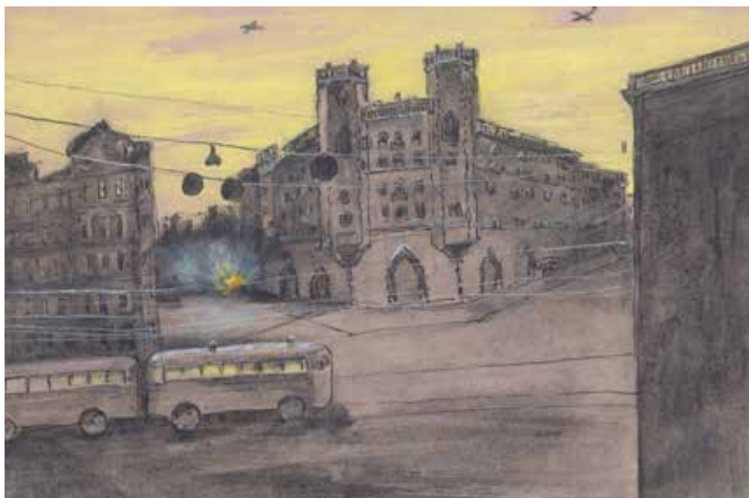
Ленинград. Во время бомбежки снаряды упали с двух сторон дома