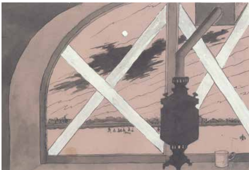
Жизнь города во время войны