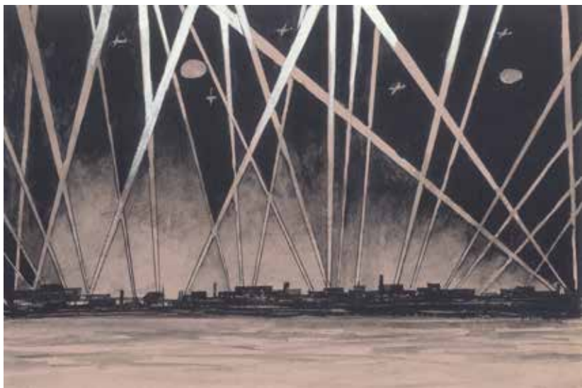
Во время ночных налетов