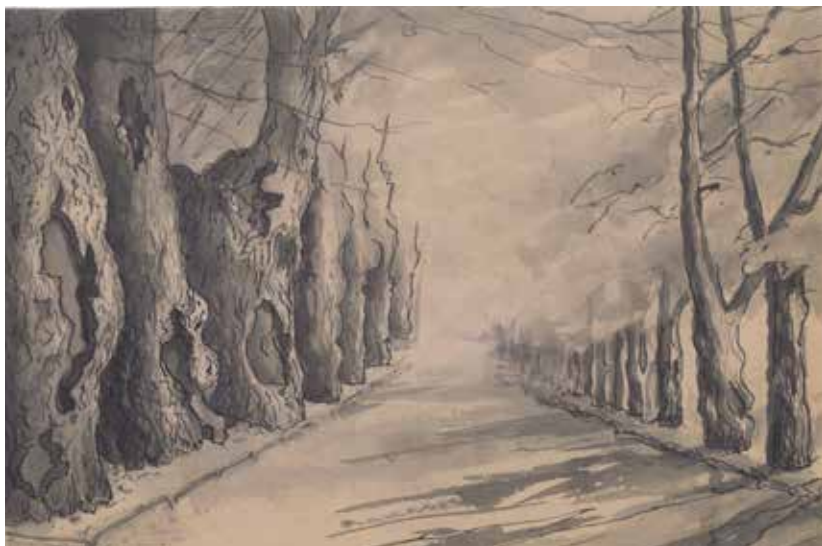
Ленинград. Летний сад