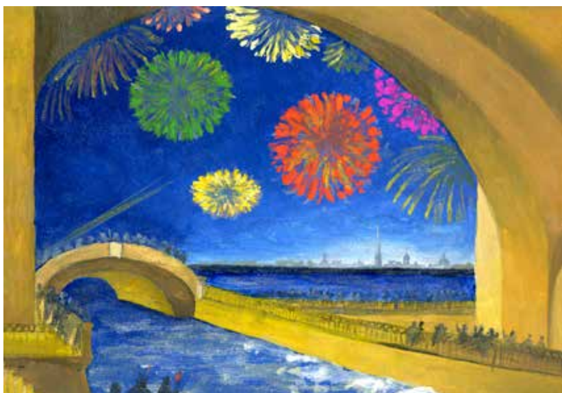
Салют в честь полного освобождения Ленинграда от фашистской блокады