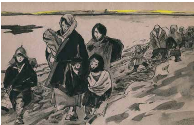
Перед отправкой на Большую землю под непрерывными бомбежками и обстрелами