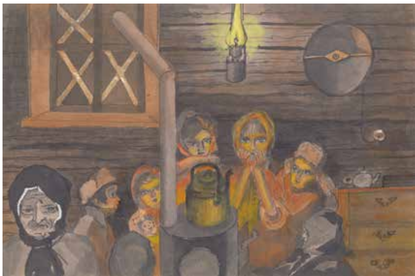
Дети согреваются у буржуйки