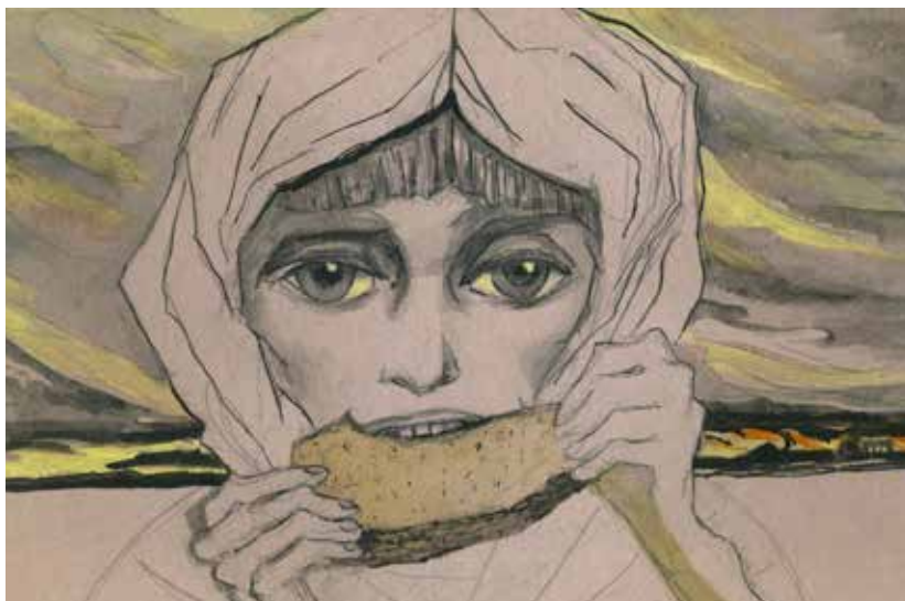
Блокадная норма хлеба