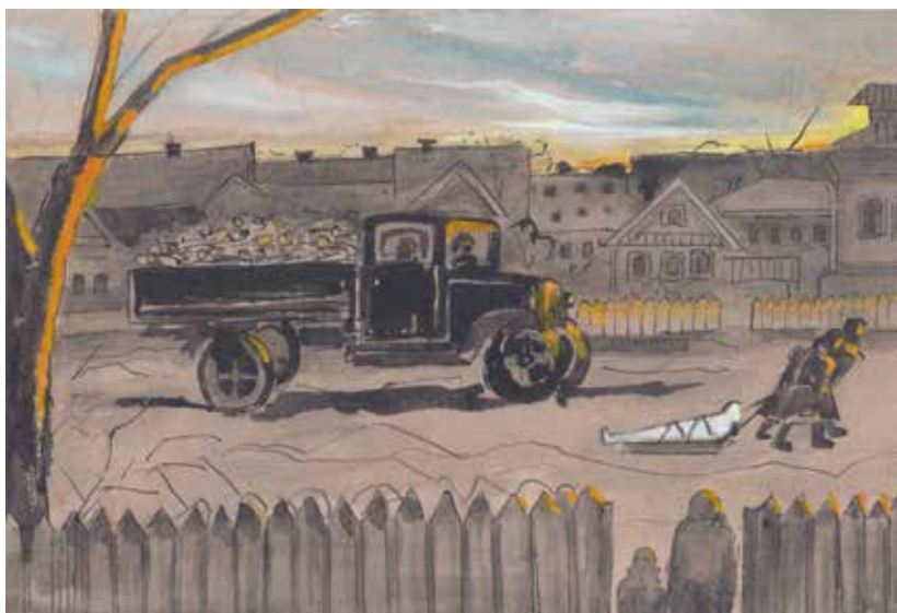
Ленинград. По нашей улице Гусевой везли обнаженные трупы на Серафимиевское кладбище